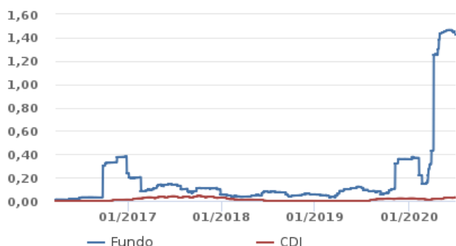
Volatilidade Anualizada (%): Janelas Móveis de 63 du