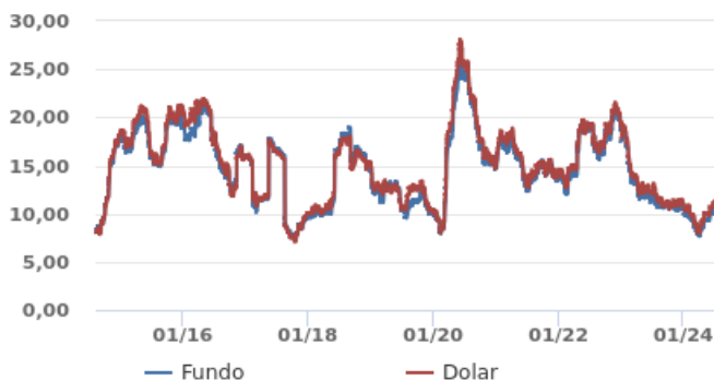
Volatilidade Anualizada (%): Janelas Móveis de 63 du